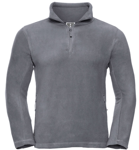
874M Quarter Zip Outdoor Fleece SIZE XS-2XL